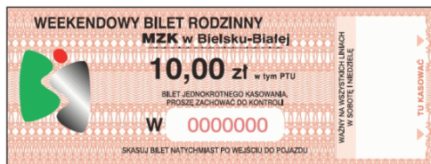
Rys. 1. Weekendowy bilet rodzinny.