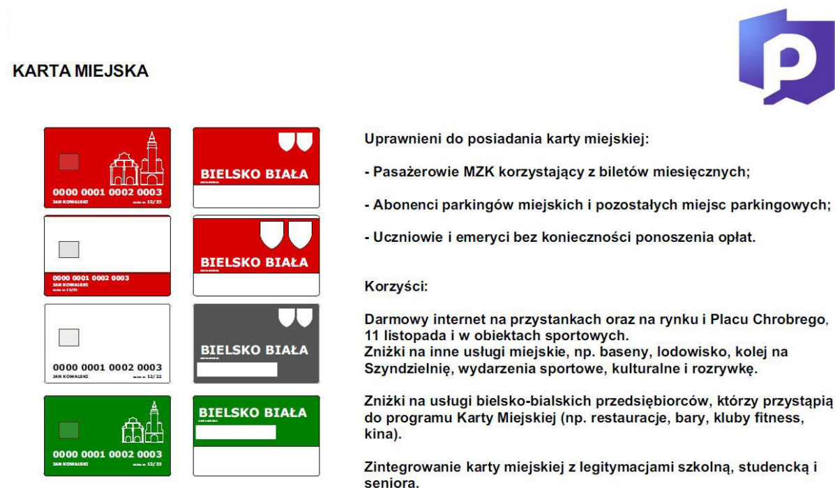
Rys. 3. Bielsko-Biała Karta Miejska.

Kolo Podbeskidzie skr. poczt. 2 43-316 Bielsko-Biała